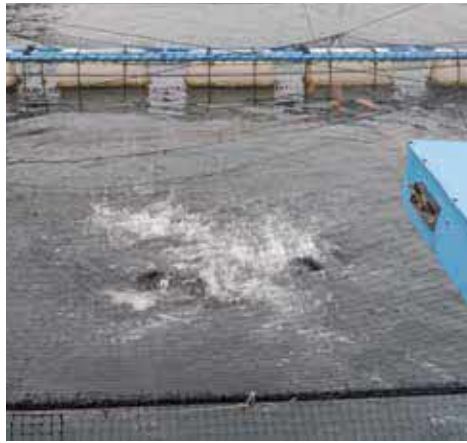
エサやりのようす(カンパチ養殖)