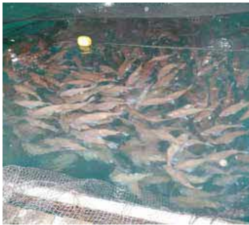
マダイ養殖生簀のようす